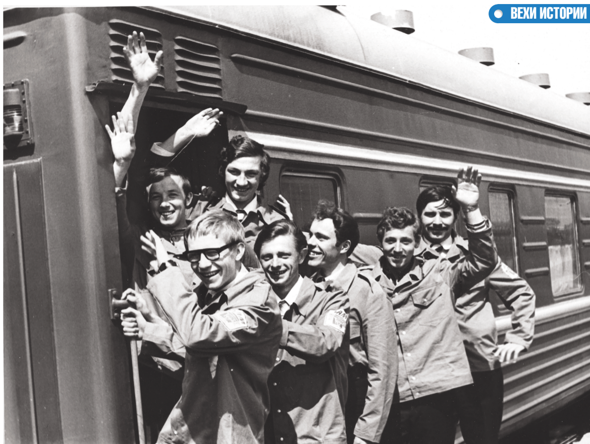
Бойцы комсомольского строительного отряда Иркутской области на перроне перед отъездом на БАМ. 31 мая 1974 г. Фотофонд ГАИО.

История БАМа на этом не заканчивается, за последние 10 лет в общей сложности уложено 3 тысячи километров пути – столько же, сколько и за период строительства «первого» БАМа, с 1974 по 1984 год. И опыт был применен тот же – почти тысяча бойцов из 35 субъектов России участвовали во Всероссийском