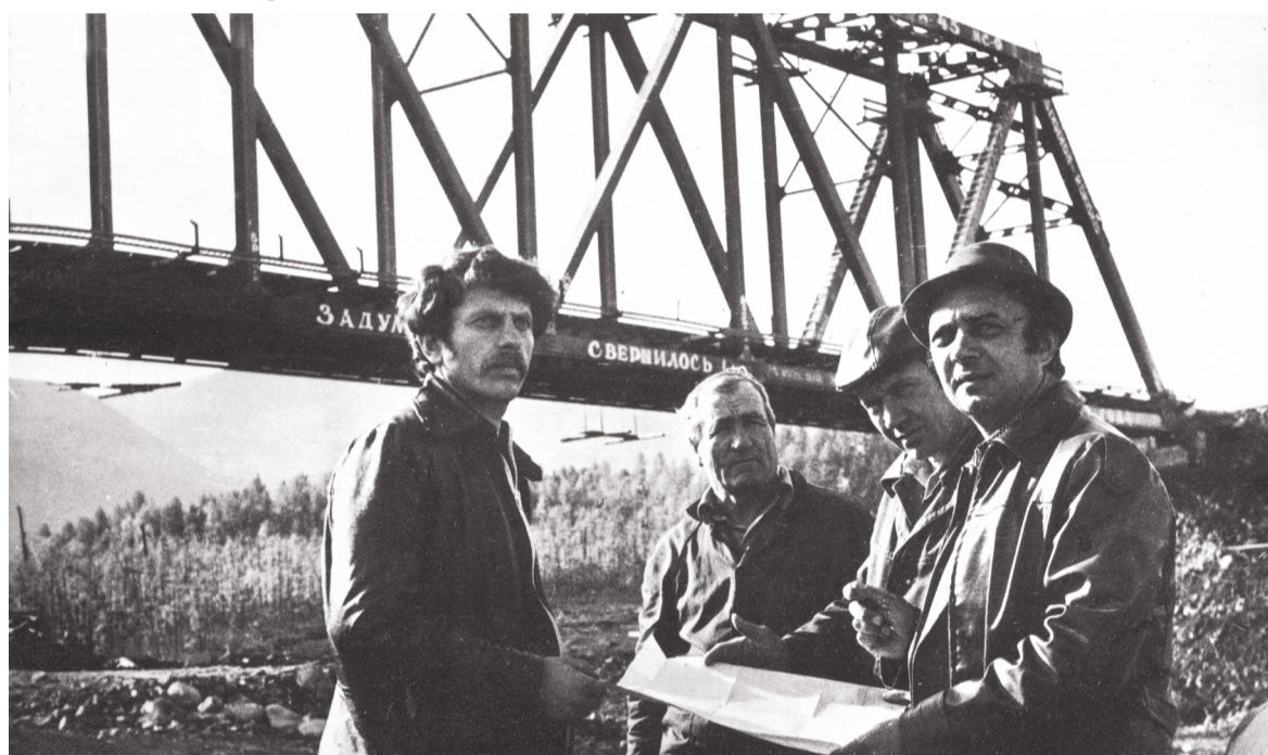
Золотой мост. Западный участок БАМа на 825 км. Монтаж пролетного строения выполняли лучшие монтажники Мостоотряда № 45 в рекордно короткий срок – за 7 дней. 4 августа 1984 г.

Сборник начинается с уникального документа с воспоминаниями первопроходцев БАМа, отправившихся в суровую тайгу в январе 1974 года, который включен в издание вместо предисловия.