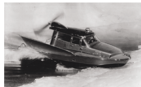
Почтовый глиссер-аэросани ПА-18. Фото. 1958 г. РГА в г. Самаре

В настоящее время некоторые способы доставки различных предметов – от книг до медицинских анализов – реализуются благодаря методу, используемому еще в конце XIX века. Это так называемая пневматическая почта (пневмопочта), вошедшая в эксплуатацию в Нью-Йорке в конце 1890-х гг. Доставка почты осуществлялась посредством системы труб, по которым письма отправлялись кратчайшими путями через весь город, а их маршрут регулировался воздушным давлением пневматической системы. На церемонии открытия пневмопочты, чтобы продемонстрировать ее возможности при пересылке разнообразных предметов, были отправлены Библия, искусственный персик и живой кот. По свидетельствам очевидцев, кот, испытав огромное давление и скорость в 55 км/ч, достиг отделения почты живым и здоровым.