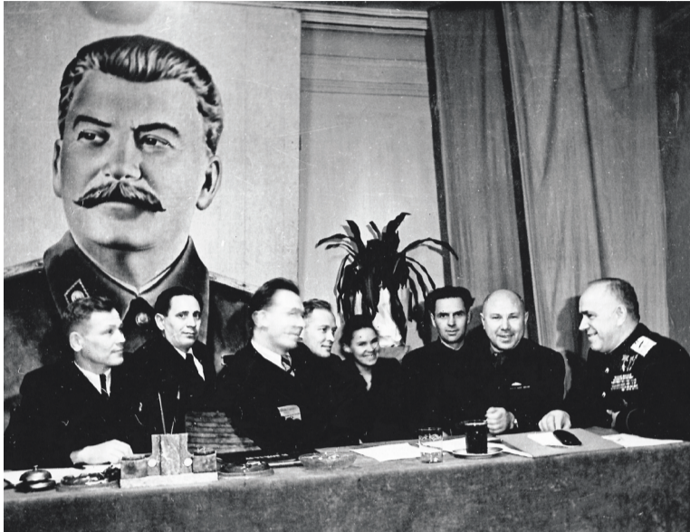
Георгий Жуков (первый справа) с участниками собрания Ирбитского районного партийного хозяйственного актива. 1952 г.

моста через реку Ирбит. Помогал колхозам Ирбитского района техникой. Решал вопросы по увеличению автобусного парка города. После пожара в Городском драматическом театре выделил средства на его восстановление. Избрание в Верховный Совет СССР от Ирбитского округа дало возможность Георгию Жукову стать кандидатом в члены Политбюро ЦК КПСС. Маршал вернулся в Москву. Получил назначение на должность Министра обороны СССР, которую занимал до 1957 года. После отставки написал книгу мемуаров «Воспоминания и размышления», опубликованную в 1969 году. Участвовал в качестве консультанта в создании документальных и художественных фильмов. Проводил памятные встречи с ветеранами Великой Отечественной войны. Георгий Константинович Жуков умер 18 июня 1974 года. Миллионы людей запомнили полководца как человека с волевым характером, который одержал множество побед во благо нашей Родины. Вопрос об увековечивании памяти маршала Жукова в городе Ирбите стал обсуждаться в середине 80-х годов. Инициатива исходила от ветеранов войны и тружеников тыла. В 1987 году Ирбитский городской Совет народных депутатов по многочисленным просьбам жителей города присвоил одной из улиц в новом микрорайоне имя Георгия Жукова. На муниципальном уровне рассматривался вопрос об от-