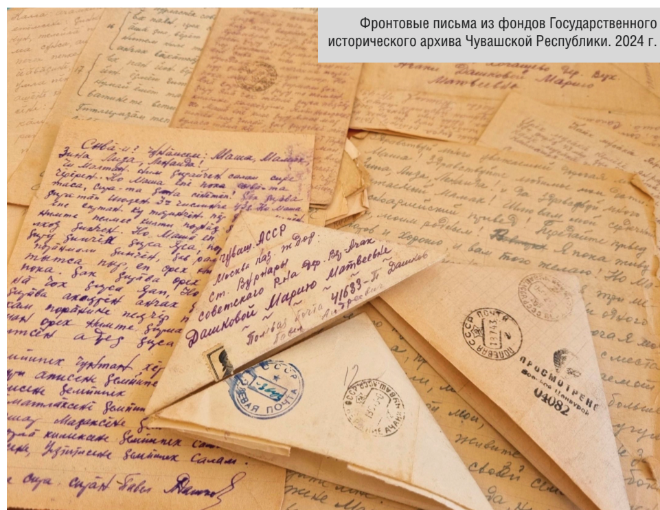
Фронтовые письма из фондов Государственного исторического архива Чувашской Республики. 2024 г.

Продолжая работу над проектом, специалисты Госистархива и архивные волонтеры проводят серию воспитатель-